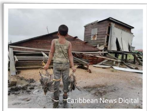
Caribbean News Digital