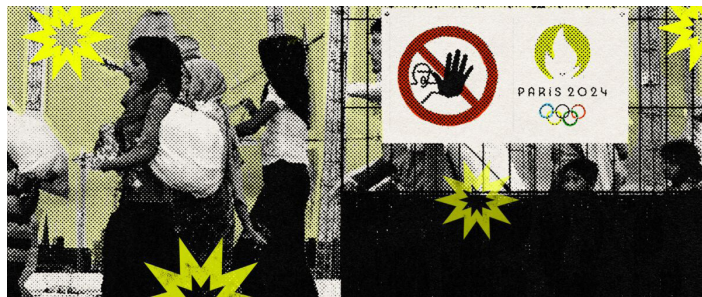
Las trabajadoras sexuales, se enfrentaban en las olimpiadas del 2024 a la discriminación y violencia de turistas, lugareños y policías que realizaban redadas para inspeccionar sus estatus migratorio. Portada de Isabella Londoño

Según la Organización Internacional del Trabajo, el negocio de la trata de personas mueve más de 32,000 millones de dólares por año en el mundo, además de que más de 12.3 millones de personas sufren situaciones laborales similares a la esclavitud. Fotografía tomada de la página del gobierno de México