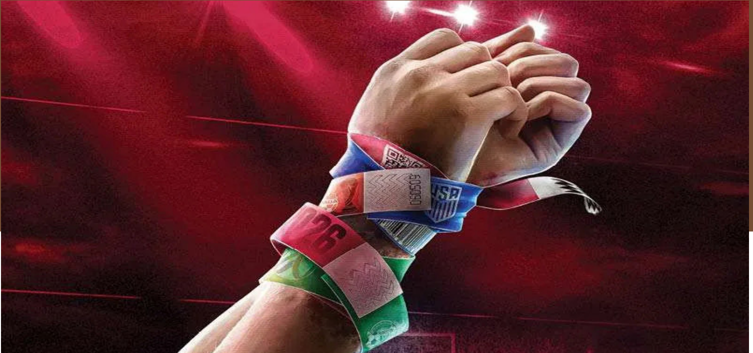
Los grandes eventos deportivos como lo pueden ser el mundial de futbol o las olimpiadas son escenarios en donde se puede dar un incremento e la trata de personas.

Análisis y Reflexión AÑO VII NÚMERO 11 29 de junio de 2026