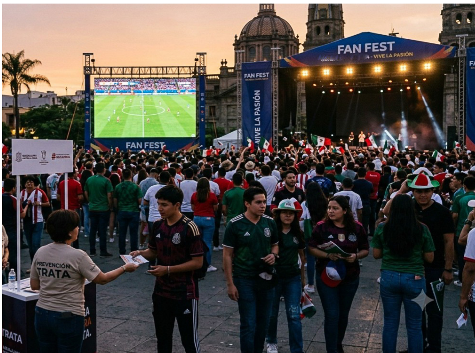
Los eventos masivos también son una oportunidad para hacer conciencia sobre el delito de la trata de personas. Imagen generada con IA

Por Jairo Meraz Flores y P. José Juan Cervantes, c.s.