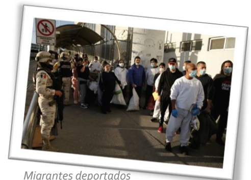
Migrantes deportados

Sin embargo, existen otros temas prioritarios que el gobierno de Biden y Harris tendrá que enfrentar además de la regularización migratoria y el restablecimiento del sistema de protección internacional y asilo: la pandemia, la crisis económica, el cambio