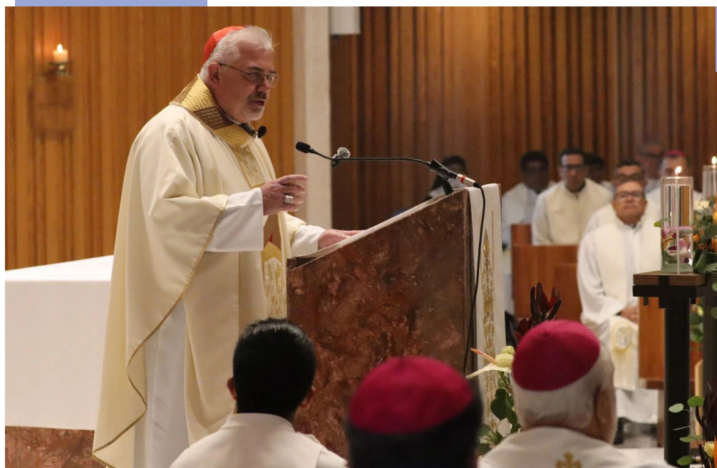
Fotografía de la Conferencia del Episcopado Mexicano

Junto a la cruz de Jesús, estaba su madre y la hermana de su madre, María, mujer de Cleofás, y María Magdalena. Al ver a la madre y cerca de ella al discípulo a quien él amaba, Jesús le dijo: «Mujer, aquí tienes a tu hijo». Luego dijo al discípulo: «Aquí tienes a tu madre». Y desde aquella hora, el discípulo la recibió en su casa.