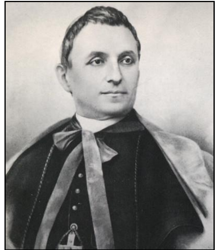
BEATO GIOVANNI BATTISTA