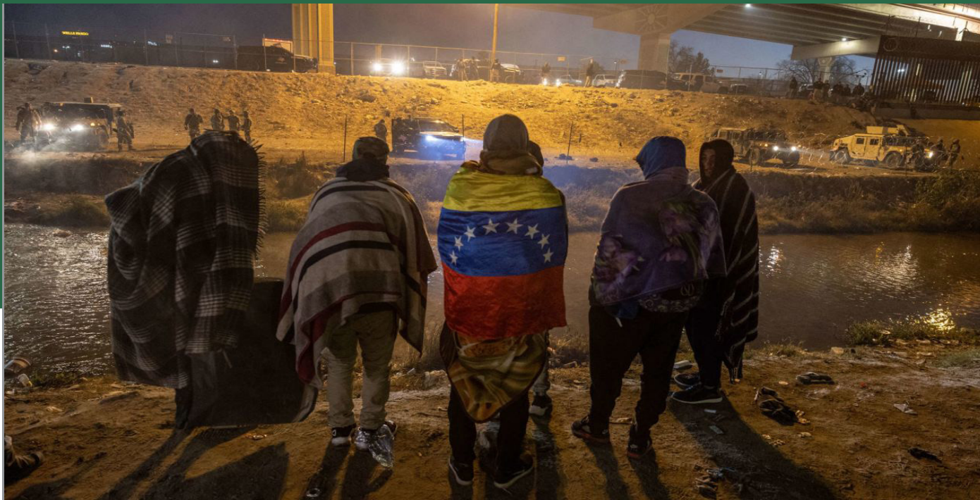
Una de las poblaciones más afectadas por el fin del TPS son los de origen venezolano.

Análisis y Reflexión AÑO VI NÚMERO 7 7 de abril de 2025