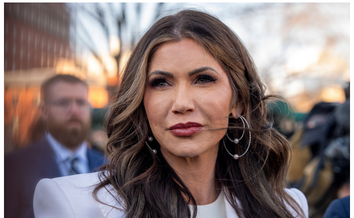
La secretaria de Seguridad Nacional, Kristi Noem, informó que la situación en Venezuela había mejorado lo suficiente como para justificar el fin de las protecciones.

Pero no todo este perdido. "Desde la mirada humanitaria" del presidente de Estados Unidos, las y los migrantes tienen la "opción" de autodeportarse, evitando un mal récord y la detención por el ICE. El gobierno norteamericano habilitó la inscripción en la aplicación CBP Home como una opción para que los migrantes puedan salir de manera voluntaria del país y evitar cualquier represalia. Quienes decidan salir deberán identificarse con una foto y otros datos biométricos que solicita la aplicación, declarar que tienen dinero suficiente para salir del país y notificar si disponen de pasaporte vigente 5 .