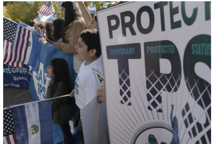
El fin del TPS causó mucha incertidumbre en las y los migrantes que estaban sujetos a este programa.

administración pública norteamericana, en el mediano y largo plazo implicarán para los Estados Unidos la pérdida de miles de millones en actividad económica.