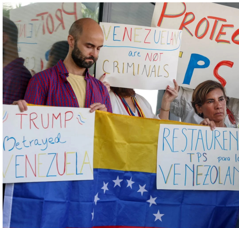
Manifestantes venezolanos protestando por el fin del TPS

Por: Jairo Meraz Flores y P. José Juan Cervantes, c.s.