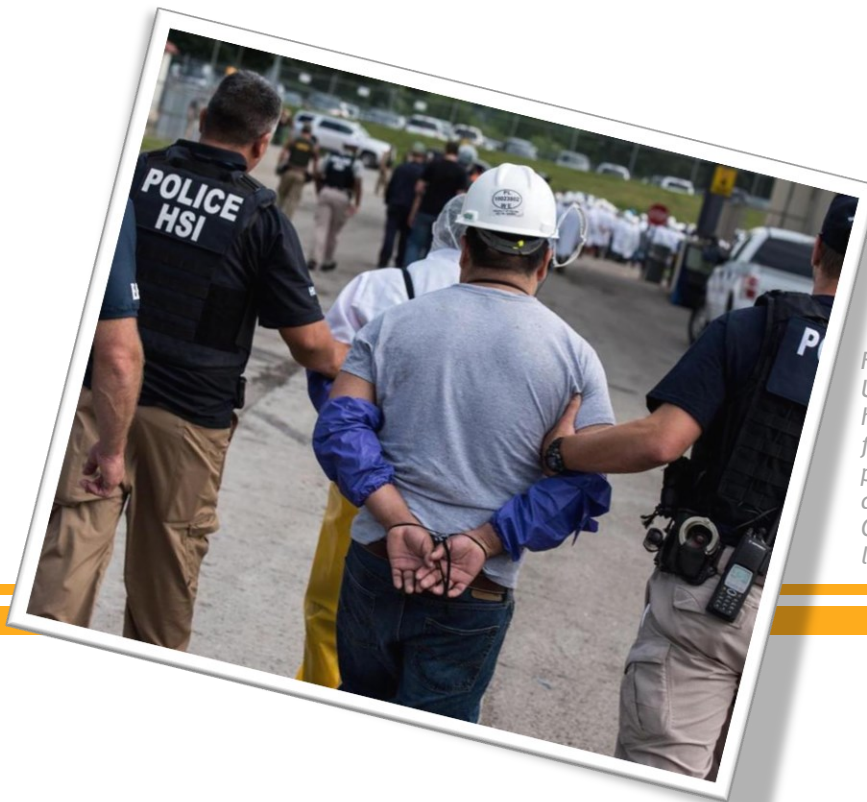
Un total de 41,368 salvadoreños, hondureños y guatemaltecos fueron deportados, sobre todo por EEUU, el primer trimestre del año, según cifras de la Organización Internacional para las Migraciones (OIM).

los no ciudadanos permanecer en sus comunidades" 5 . La Coalición Internacional contra la Detención informa de que "se ha demostrado que los programas de "ATD" basados en la comunidad mantienen altos índices de cumplimiento... cuando los migrantes pueden satisfacer sus necesidades básicas y acceder al apoyo jurídico y social necesario para tomar decisiones informadas sobre su viaje migratorio" 6 . Ser inscrito en el programa de Alternativas a la Detención, no elimina la posibilidad de ser deportado. Las personas que viven bajo el "ATD" tienen la oportunidad de vivir en Estados Unidos, pero viven en un estado de limbo, sin saber lo que pueda suceder en la vista judicial que determinará su situación migratoria.