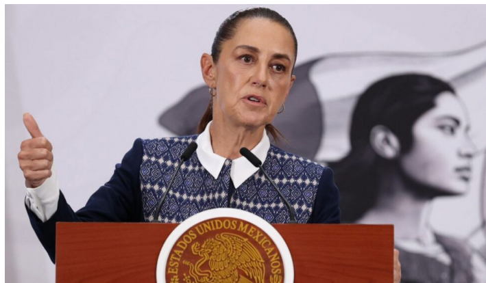
La presidenta Claudia Sheinbaum ordenó que los consules realicen visitas diarias a los connacionales retenidos en Estados Unidos.

El 30% de las personas migrantes fallecidas eran mexicanas 2 . Este dato sugiere un “perfilamiento nacional” en contra de ciudadanos mexicanos, quienes han sido caracterizados por Donald Trump con calificativos como “bad hombres”, “terroristas”, “delincuentes”, “invasores”,