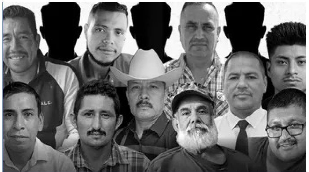
Llama la atención que todas las víctimas mortales son hombres y que entre las principales causas de muerte destacan suicidio y complicaciones médicas que no fueron atendidas por las autoridades correspondientes.

En declaraciones públicas, los funcionarios del actual gobierno de México, cuando se refieren a las personas migrantes que viven en Estados Unidos (sin importar su condición migratoria), las nombran como "heroínas y héroes migrantes", subrayando la importancia de su contribución económica al país. Sin embargo, cuando los "paisanos" necesitan asistencia consular por cualquier motivo, se vuelven invisibles: solo cuentan cuando envían remesas.