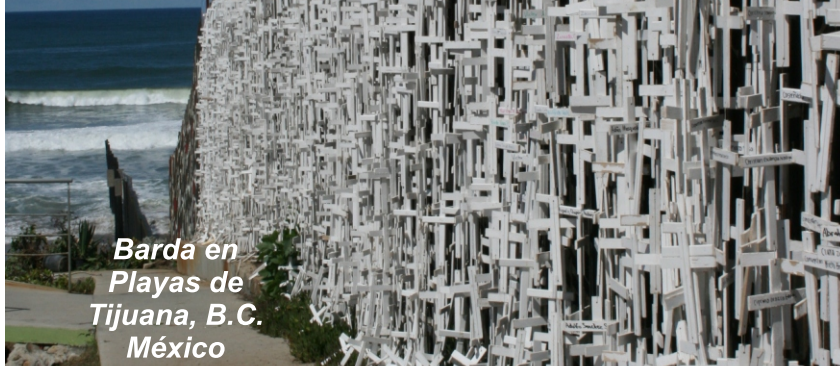
Barda en Playas de Tijuana, B.C. México

Dolor, sufrimiento y muerte, son partes de la odisea del migrante