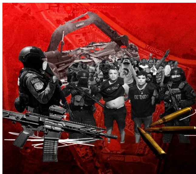
Diseño de Voz Media

Por: Jairo Meraz Flores y P. José Juan Cervantes, c.s.