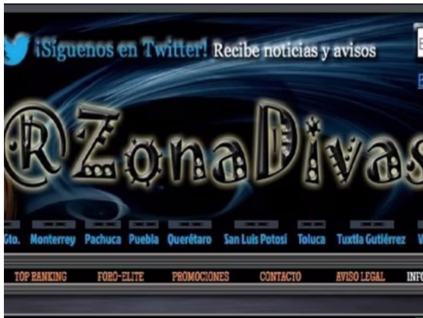
Imagen de Zona Divas

Las víctimas suelen caer en las redes de trata por la necesidad de sustentar a sus familias en sus lugares de origen o para seguir avanzando en la ruta migratoria. En la Ciudad de México, la alcaldía de Iztapalapa tiene mayor cantidad de reportes de trata de personas, seguida por las alcaldías Cuauhtémoc y Gustavo A. Madero. Los focos rojos de trata de mujeres en la Ciudad de México están alrededor de la Central del Norte, la Merced, las colonias 20 de Noviembre y Venustiano Carranza, y la zona que rodea la plaza Giordano Bruno, donde se estableció un campamento de aproximadamente 500 personas solicitantes de refugio, el cual fue desalojado el 5 de junio pasado por personal del INM 4 .