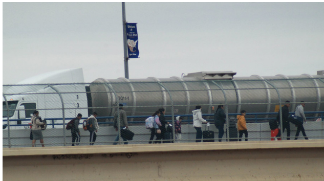
Se está haciendo común ver familias enteras ser deportadas hacia México o a sus países de origen sin posibilidad de volver intentar regresar

Nacionales o extranjeros, los migrantes desgraciadamente siguen pareciendo fichas de ajedrez en una partida que juegan quienes tienen intereses políticos y económicos que poco tienen que ver con la dignidad humana y la justicia.