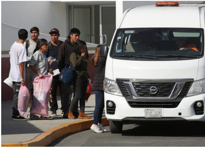
Quando los deportados no cuentan con recursos económicos son trasladados a la Central gratuitamente

El gobierno que promueve el “humanismo mexicano” no tiene un programa definido para atender de manera integral las necesidades de los extranjeros que permanecen en México de manera irregular. La falta de políticas para la protección y la integración a la sociedad de quienes permanecen en México sin protección jurídica, sin decirlo tácitamente, está obligándolos a realizar un éxodo inverso hacia el sur por sus propios medios para evitar ser “asegurados” por el Instituto Nacional de Migración (INM) o la Guardia Nacional (GN) y ser enviados a Guatemala, Costa Rica y Panamá, enfrentando un futuro incierto sin la certeza de que sus derechos humanos sean garantizados 2 .