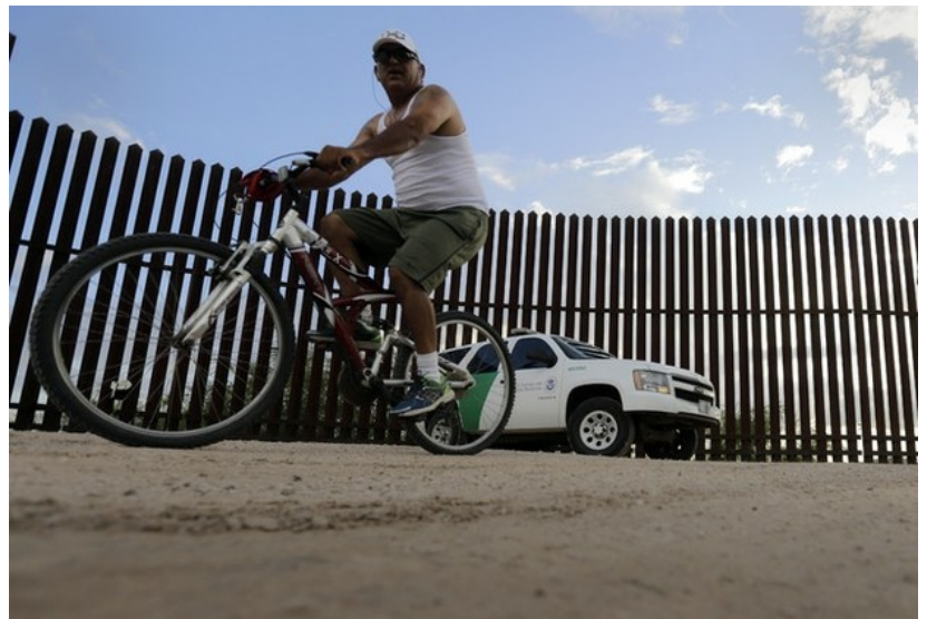
Valla fronteriza en Hidalgo, Texas.

"Como madre de un niño pequeño, me es fácil imaginar lo traumatizante que puede ser para un niño ver cómo agentes de inmigración entran en casa de alguien y separan familias", señaló la congresista, que añadió que "estos menores podrían ser nuestros hijos y sobrinos".