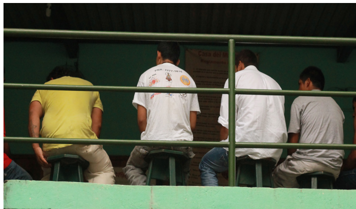
Las Casas del Migrante Scalabrini han sido un oasis para las y los migrantes que con mucho sufrimiento y esperanzas desean llegar a la tierra prometida.

únicos puntos de concentración de personas migrantes y solicitantes de asilo: las capitales se han convertido en espacios estratégicos. Las personas en condición de movilidad humana parecen ser cada vez más vulneradas, víctimas de abusos y atropellos.