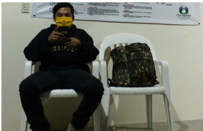
La migración es cada vez más peligrosas y que los costos se han incrementado complicando la movilización de miles de personas.

Actualmente, la mayoría de los migrantes sale de sus países de manera forzada; muchos también se ven obligados a desplazarse dentro de su propio territorio por motivos de seguridad. Además, los lugares de origen se han diversificado. Las ciudades fronterizas ya no son los