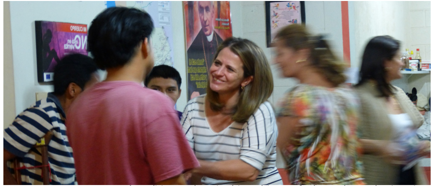
Los religiosos, voluntarios, laicos y laicas son fundamentales para la asistencia y el acompañamiento de las y los migrantes.

Deseamos que, laicos y religiosos, compartiendo la herencia que San Juan Bautista Scalabrini dejó a la Iglesia, sigamos haciendo de las Casas del Migrante Scalabrinianas espacios seguros, lugares de encuentro e instituciones que favorecen la cooperación entre diversos actores de la sociedad para acoger, proteger, promover e integrar a migrantes y refugiados en las ciudades donde estamos presentes.