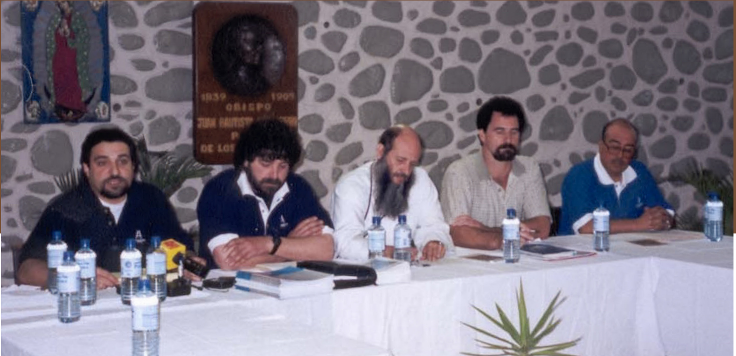
Presentación del documento "El clamor de los migrantes" 8 de marzo 2000.

Análisis y Reflexión AÑO VII NÚMERO 4 16 de marzo de 2026