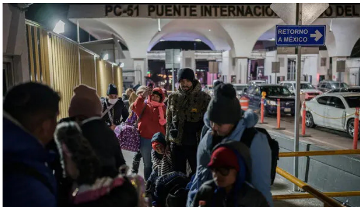
No se sabe si el gobierno mexicano está realmente preparado para afrontar el trauma a largo plazo que podrían causar las deportaciones y las separaciones familiares.

El gobierno de Estados Unidos ha “deportado” a México personas de otras nacionalidades, algo que el gobierno mexicano no está obligado a aceptar. Las deportaciones corresponden únicamente a ciudadanos de nuestro país. Según la legislación internacional, los ciudadanos