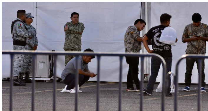
“México te abraza”, es un programa implantado desde febrero 2025, cuando comenzaron las deportaciones aéreas

En enero de 2025, el gobierno de México anunció la creación del programa “México Te Abraza” ante la amenaza de una deportación masiva de mexicanos. El programa prometía implementar una serie de acciones coordinadas entre gobierno federal, los gobiernos estatales y la iniciativa privada para recibir de manera