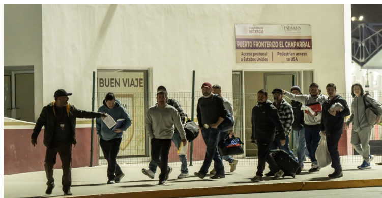
Los mexicanos deportados de Estados Unidos en ocasiones son recibidos a altas horas de la noche por el INM y trasladados a los albergues instalados en las diferentes fronteras del norte de México.

La estrategia de Trump para cumplir su promesa de llevar a cabo la “deportación más grande de todos los tiempos”, está poniendo en jaque no solo a las personas directamente afectadas y a sus familias, sino también a la estabilidad social. Está generando división al interior de Estados Unidos, violando el sistema jurídico internacional y obligando a los países de la región a replantear sus políticas sociales.