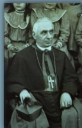
Beato Juan Bautista Scalabrini