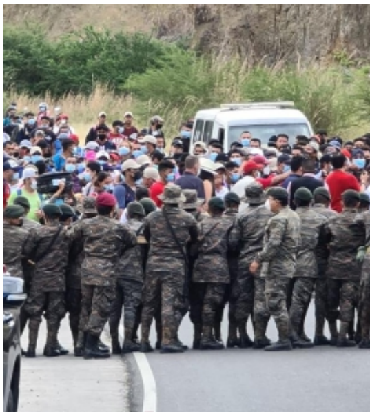
enero 2021

Oramos por nuestras autoridades que tienen la responsabilidad de promover una vida digna para todas las personas