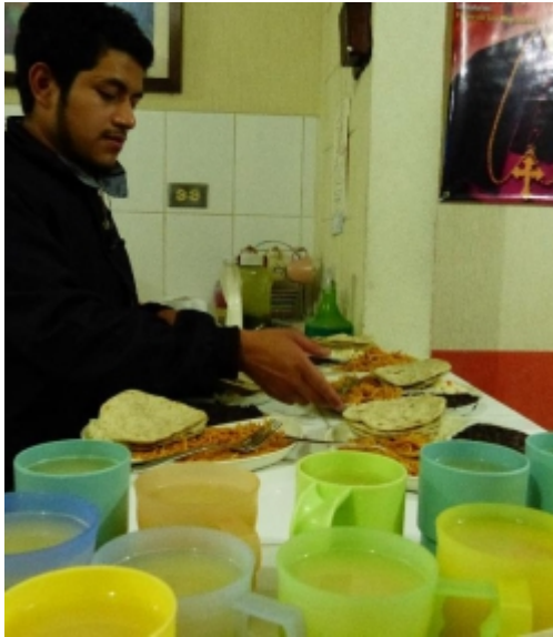
Casa del Migrante, Cd. De Guatemala, 2017

Oramos por todos los cristianos para que podamos descubrir la presencia de Jesús en los migrantes y refugiados