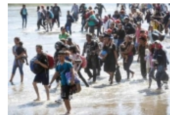
Río Suchiate, 2020

Defiéndelos del peligro y fortalece su fe para que busquen la felicidad no solamente en este mundo sino también para la vida eterna. Que, como peregrinos de la Iglesia de Dios, puedan alcanzar la ciudad celestial y disfrutar la vida eterna contigo y para siempre.