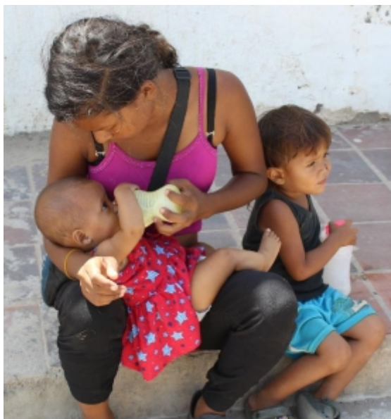
1 de febrero 2020

https://migrants-refugees.va/es/recursos/fotos/