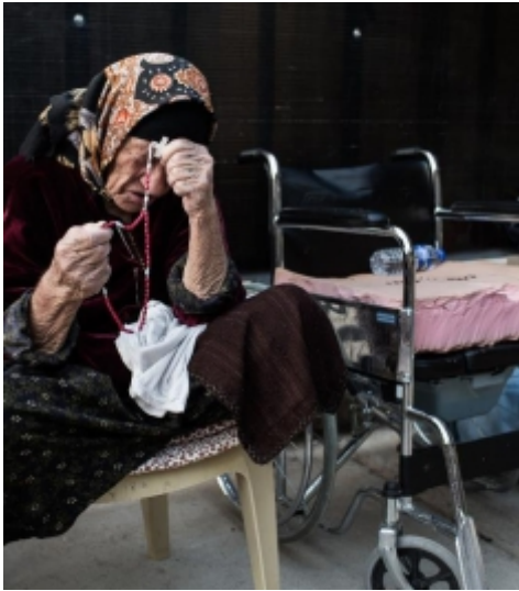
Foto de Daniel Etter para Catholic Relief; Migrants & Refugees, 28 de agosto 2014

Oramos por los migrantes y refugiados para que encuentren quien los acompañe en los momentos de angustia y dolor