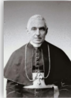
Scalabrini 1839-1905

Oh, Beato Juan Bautista Scalabrini, misionero de la palabra, ministro de la Eucaristía y de la Iglesia hombre de caridad y comunión, hijo devotísimo de María, apóstol del catecismo y Padre de los Migrantes, recurrimos a tu intercesión para obtener la bendición de Dios sobre nosotros y sobre nuestros seres queridos, sobre quienes viven las dificultades de la migración y sobre toda la humanidad. Concédenos de la Santísima Trinidad la gracia que te imploramos...y que con confianza te encomendamos.