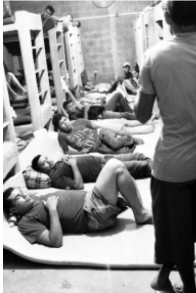
2018, Tenosique, Tabasco

Oramos por los migrantes y refugiados para que sean tratados dignamente