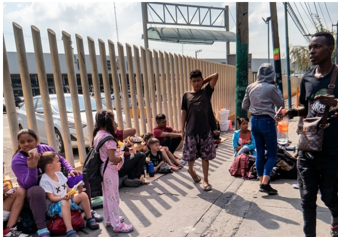
Ante el aumento de las denuncias, ya fue presentada una queja ante la Comisión Nacional de los Derechos Humanos para exigir una investigación sobre los operativos y posibles violaciones de derechos.

Las ciudades sede del Mundial, independientemente del país en el que se encuentren, pueden considerarse “ciudades globales”, caracterizadas por su alta conectividad e influencia financiera, cultural y tecnológica. Estas ciudades acogen a turistas que permanecen poco tiempo y generan una derrama económica para la población local (al menos en teoría), mientras que, en contraste, se ignora y se explota a las personas migrantes.