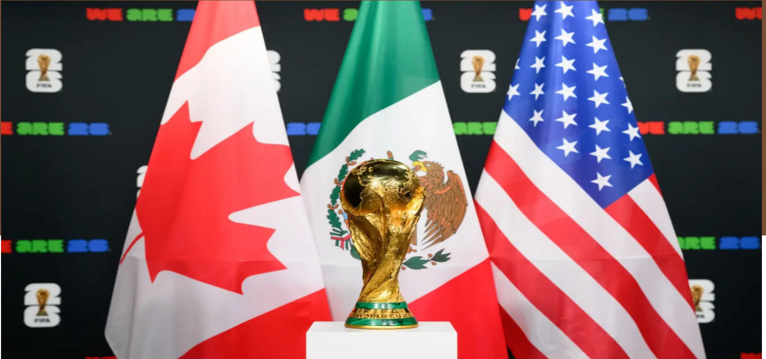
México será sede del Mundial 2026 junto a EE. UU. y Canadá, convirtiéndose en el primer país en organizar tres copas del mundo (1970, 1986, 2026).

Análisis y Reflexión AÑO VII NÚMERO 8 18 de mayo de 2026