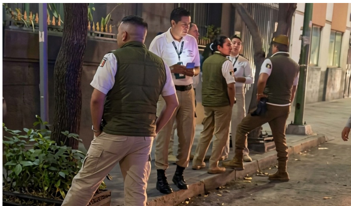
Los controles se realizan sin evaluaciones claras y han derivado en la detención de personas que incluso cuentan con tramites legales ante la Comisión Mexicana de Ayuda a Refugiados.

Por su parte, Qatar 2022 evidenció un sistema de patrocinio laboral que vinculaba legalmente a los trabajadores con sus empleadores. Este esquema de contratación les impedía a los trabajadores cambiar de trabajo o salir del país sin autorización. Las jornadas