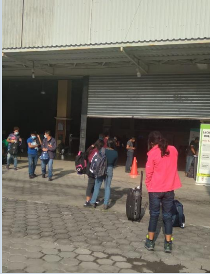
Deportados arriban a las instalaciones del Centro de Retornados en Tecún Umán