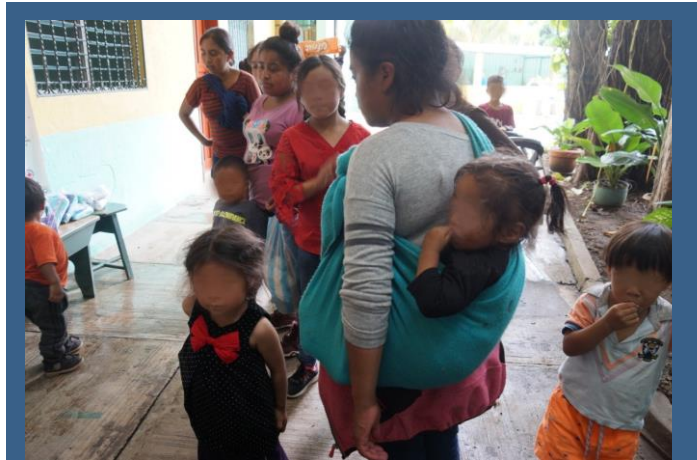
Mujeres y niños migrantes guatemaltecos que son abandonados en el puente internacional de la frontera México Guatemala por agentes de migración.

Algunos haitianos que están varados en Tapachula también son deportados de manera informal, llevados en vehículos del Instituto Nacional de Migración de México al puente fronterizo. Estos deportados fueron detenidos en Tapachula, en alguna ciudad de México o en la frontera con Estados Unidos y “regresan” a territorio guatemalteco sin ningún registro. Los “coyotes les ayudan” a regresar de manera irregular a México. Esto se está convirtiendo en un círculo vicioso, las autoridades mexicanas los dejan en el puente y los migrantes vuelven a ingresar por otro lugar.