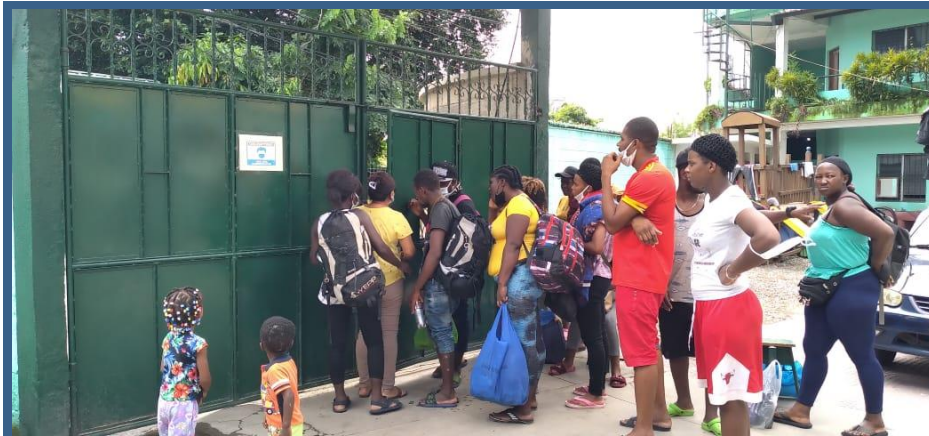
Familias y personas migrantes haitianos buscan refugio en la casa del Migrante Sin Frontera en Tecún Umán